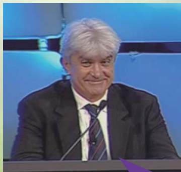
講演者 Pier Paolo Cortellini ピエル・パオロ・コルテリーニ