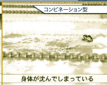
コンビネーション型