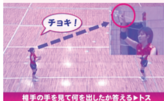
相手の手を見て何を出したか答えるトス