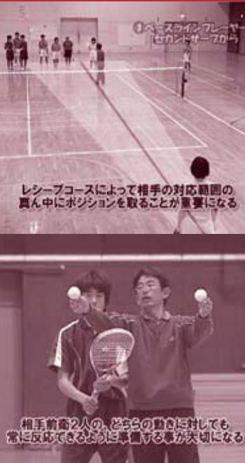
レシーブコースによって相手の対応範囲の真ん中にポジションを取ることが重要になる